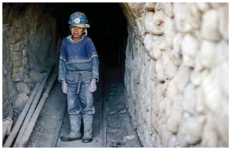
N°1 : «Tomacito» d'Olivier FÖLLMI Format 30x40