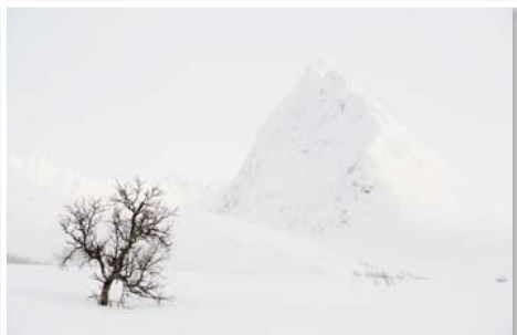
N°3 : «Contraste sur un pic enneigé» de Patrick DELIEUTRAZ Format 50x75 sur Dibond Numérotée 1/15