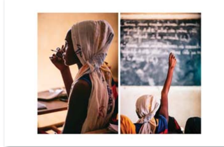
N°12 : «L'écolière du désert» de Antoine TARDY - Format 40x60 Numérotée 1/30