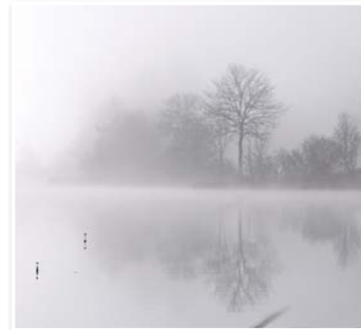
N°9 : «Etang de Lésines» de Elizabeth SCHNEIDER - Format 21x21 papier mat Numérotée 2/10