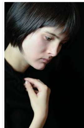
N°11 «Valentine» de Jean-Claude BRUET Format 40x60 sur Dibond