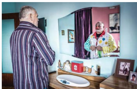
N°17 : «The volunteer inside you» de Alfano MASSIMO - Format 40x60 sur Dibond