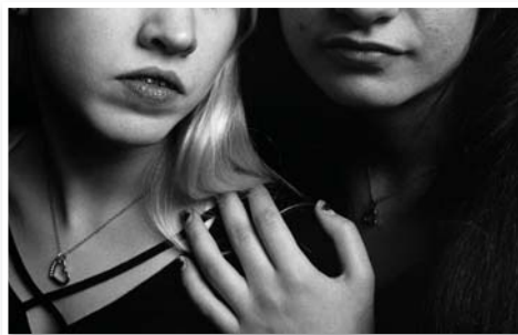
N°20 : «Fovea» de Sarah SEENE - Format 40x60 sur Dibond