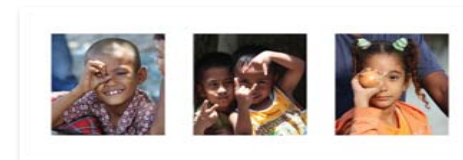
N°10 : de Jean-Claude ALLARD Format 30,2x80 sur Dibond Numérotée 1/3