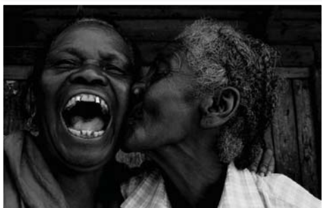
N°19 : «Fihavanna» de Rémy PINATON - Format 40x60 sur Dibond