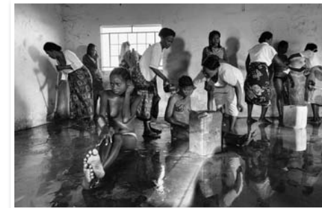
N°13 : «Altruisme d'une population démunie devant la maladie» de Christian BARBE - Format 40x60 sur Dibond