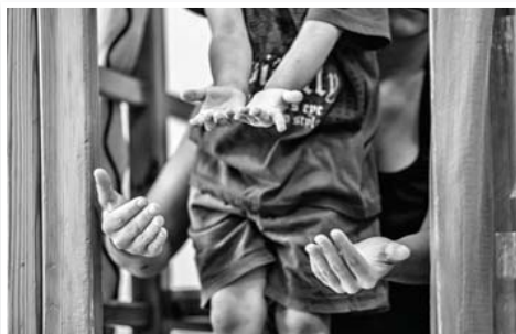
N°16 : «Avec l'autre» de Pierre GABLE - Format 40x60 sur Dibond