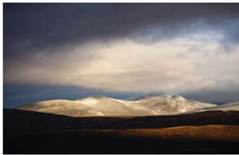
N°5 : «Kringluthoi» de Sylvain DUSSANS - Format 50x75 Numérotée 1/30