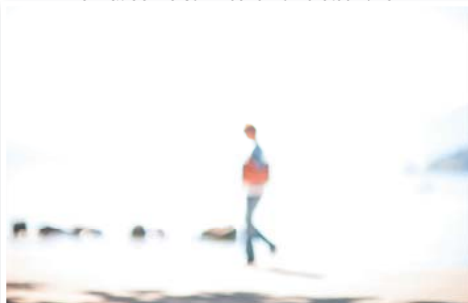
N°4 : «Elle marche» de William PESTRIMAUX - Format 20x30 encadrement 40x50 Passe Partout Numérotée 4/11