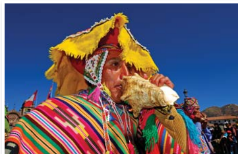
N°7 : « Fête de l'inti Raimi (Cuzco)» de Jean PICHON Format 60x90 sur Dibond