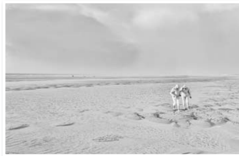
N°6 : «Lunaire» de Christian PONCET Format 40x60 Numérotée 3/12 signée Tampon à sec