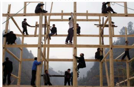
N°8 : «Miao construisant une maison» de François SUCHEL - Format 40x60 Canson Infinity Numérotée 2/10