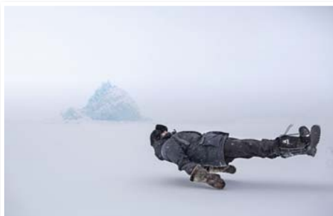
N°2 : «Histoire de banquise» de Christian MOREL- Format 50x75 sur Dibond